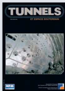
Photo de couverture : Tunnel de Sotiello/Pajares. Tunnelier Roche dure NFM. Record d'avancement en Espagne de 1140 m en 1 mois.

Les articles signés n'engagent que la responsabilité de leur auteur. Tous droits de reproduction, traduction, adaptation, totales ou partielles sous quelques formes que ce soit, sont expressément réservés.