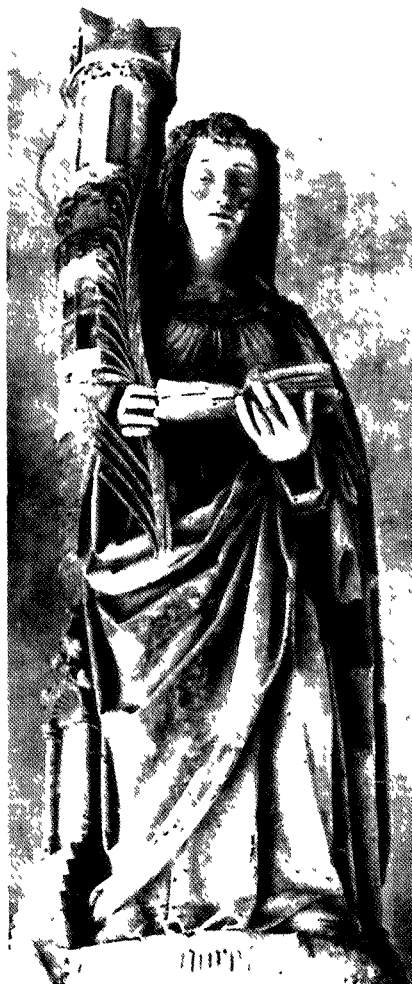
Sainte Barbe église de Soumaintrain (Yonne).