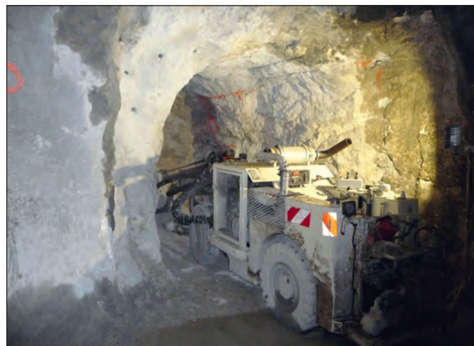
Creusement d'un carneau de désenfumage.