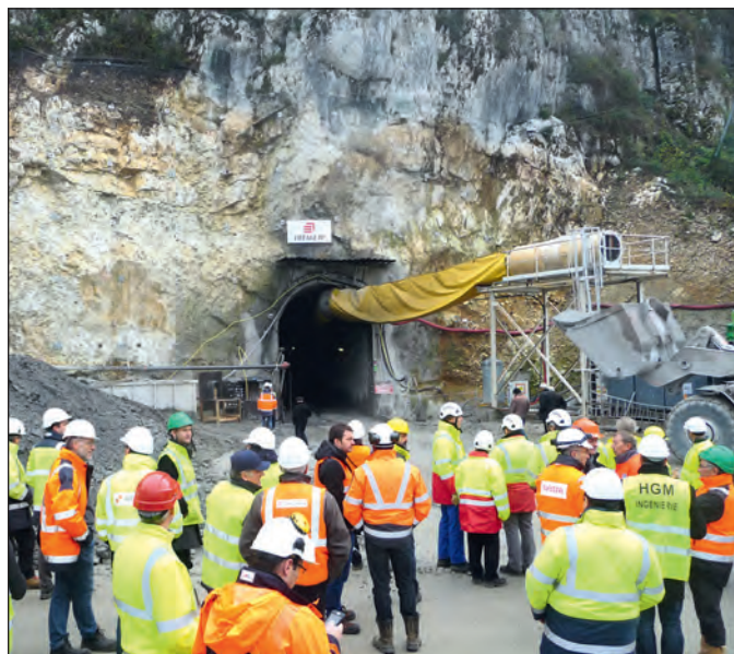
Entrée de la galerie côté Yenne.