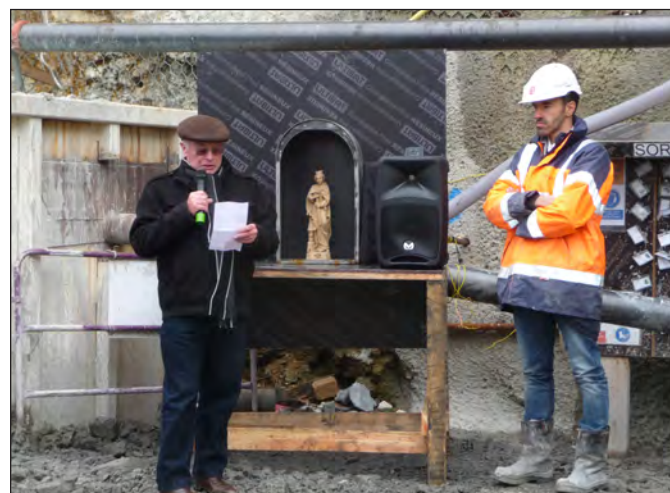
Bénédictiction de la Statue de Sainte Barbe