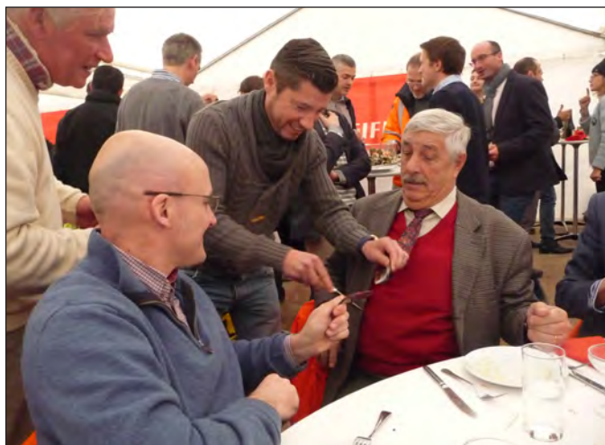
La tradition retrouvée des cravates coupées...