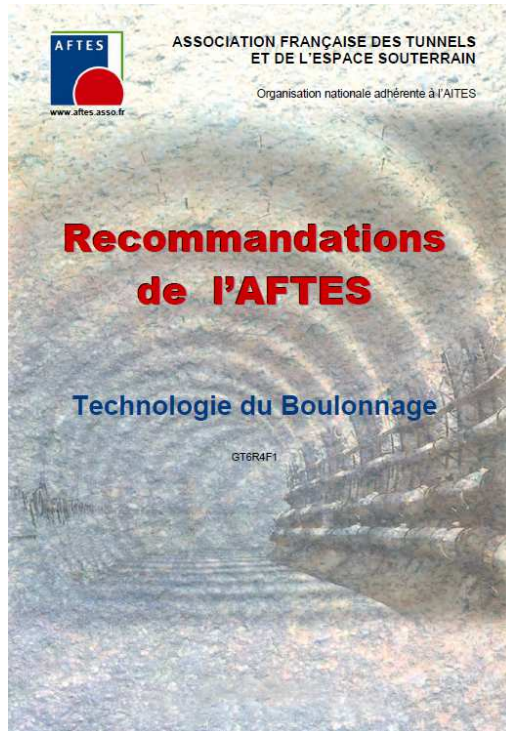
GT 6 - Paul ROUX