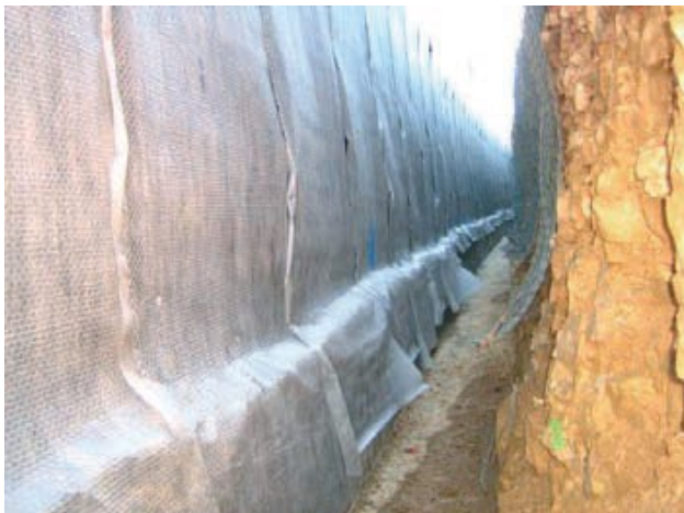
Pose verticale de la nappe FONDA GTX