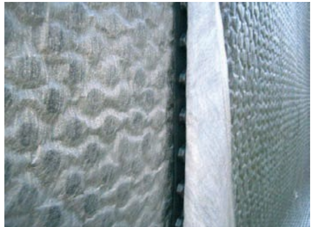
Détail recouvrement vertical

La nappe est fixée en tête, à au moins 5 cm du bord supérieur du rouleau, au fur et à mesure du déroulage en prenant soin de plaquer la nappe contre le support. Le géotextile du lé supérieur est décollé à sa base dans la largeur du recouvrement. Celui du lé inférieur et celui du lé supérieur sont alors remis en place en se recouvrant dans cet ordre. La nappe de FONDA GTX doit dépasser au minimum de 10 cm le niveau du remblaiement.