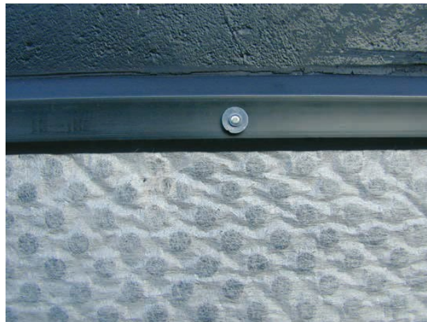
Détail d'une fixation